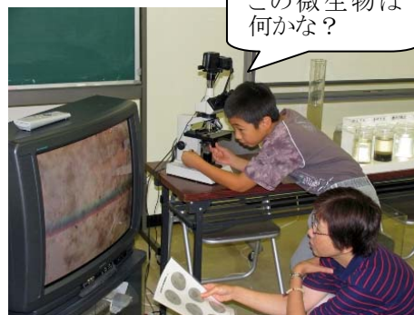
特別見学会・顕微鏡観察