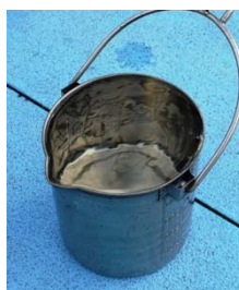
⑤急速ろ過池を経た水