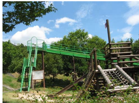
ワールドアスレチック