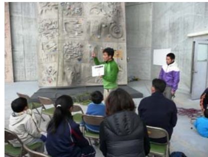
アウトドア講習会 クライミング体験教室