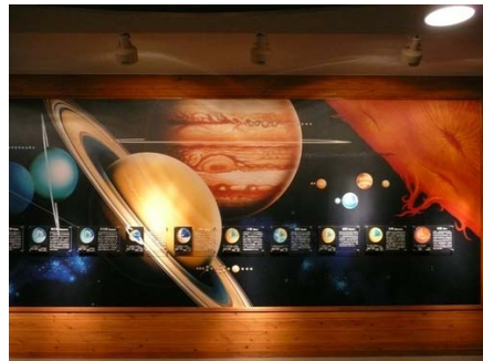
天体観測施設 内部展示