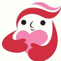
犯罪被害者等支援シンボルマーク 「ギョットちゃん」

犯罪被害者等がひとりの県民として、一日も早く平穏な暮らしを取り戻すことができるよう、国、県、市町ならびに県民、事業者および民間支援団体その他の関係者が連携し、県民みんなで犯罪被害者等の心に寄り添った支援施策を総合的かつ計画的に推進することを図るため、滋賀県犯罪被害者等支援条例を制定しました。