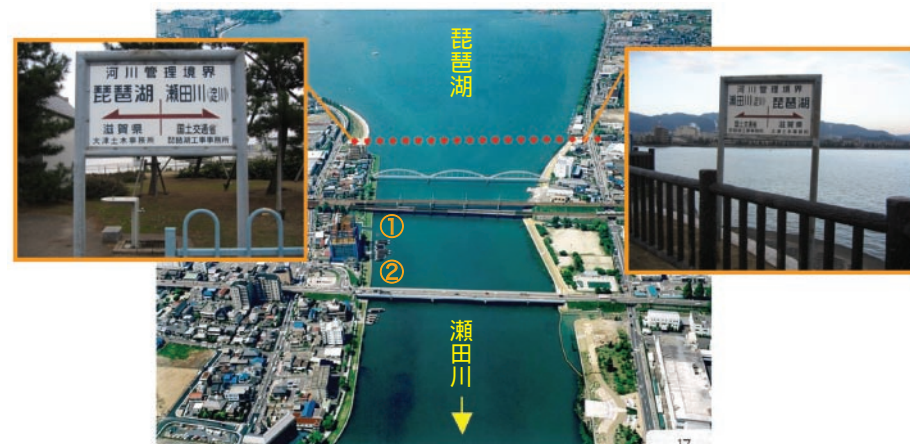
写真T6-1-1 現在の琵琶湖と瀬田川の境界