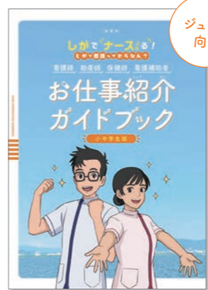
お仕事紹介ガイドブック 小中学生版