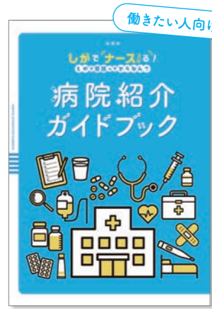
病院紹介ガイドブック

“滋賀県にはどんな病院があるの?” これで解決! 滋賀県内の病院の特徴 や教育体制などを看護職にスポット をあて紹介しています。