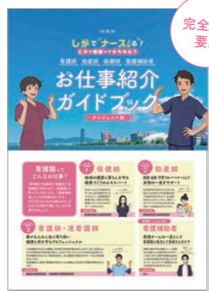
お仕事紹介ガイドブック ダイジェスト版

看護職の仕事内容、働き方などをあますところなく紹介。現役看護職へのインタビュー記事では、滋賀県で働く看護職員が、看護の仕事のやりがいや魅力を本音で語っています。