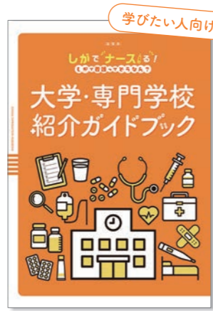
大学・専門学校紹介ガイドブック

“滋賀県にはどんな病院があるの?” これで解決! 滋賀県内の病院の特徴 や教育体制などを看護職にスポット をあて紹介しています。