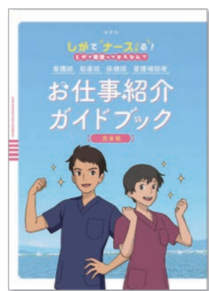
お仕事紹介ガイドブック 完全版

看護職の仕事内容、働き方などをあますところなく紹介。現役看護職へのインタビュー記事では、滋賀県で働く看護職員が、看護の仕事のやりがいや魅力を本音で語っています。