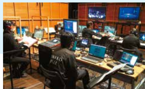
びわ湖ホールには舞台技術などの専門職員がいる。11月の『マイア受難曲』より新しく機材を揃え有料配信を開始しました。

ホールでの公演と、専属の音楽アンサンブルが県内外各地に出向いての公演などの活動に加えて、ホールの第3のサービスとして、今後もネット配信を続けていきます。まずはホームページにアクセスして配信をぜひ一度ご覧ください。