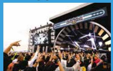
2019年のイナズマロックフェスの様子