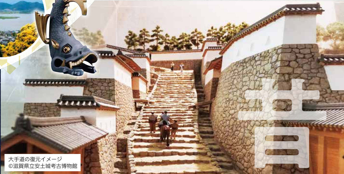
大手道の復元イメージ ©滋賀県立安土城考古博物館