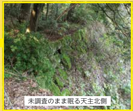
未調査のまま眠る天主北側