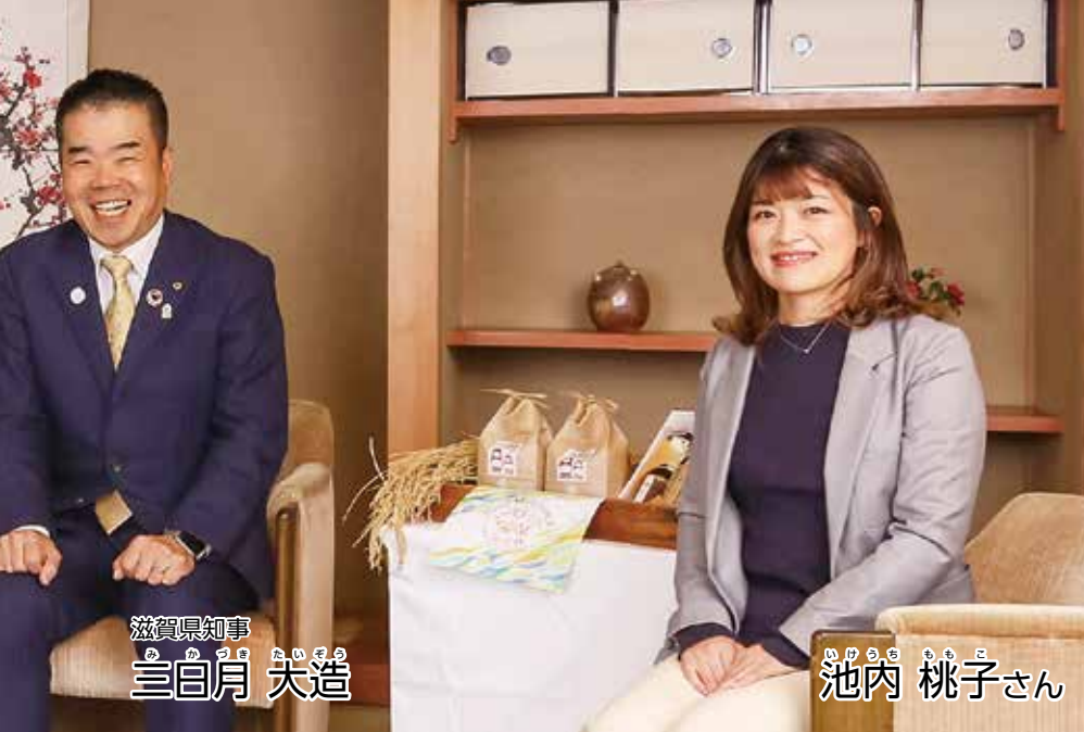
滋賀県知事 三日月 大造

女性ならではの視点で農業を楽しみ、自分らしく生きる。いま、「農業女子」という生き方が注目されています。滋賀の豊かな風土の中で輝く農業女子たちに、農業にかける思いを語っていただきました。