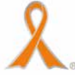
オレンジリボンマーク