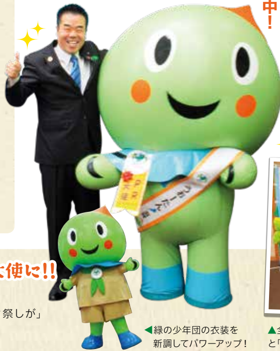
緑の少年団の衣装を新調してパワーアップ!

現在、世界中で猛威を振るっている「新型コロナウイルス感染症」の影響で全国植樹祭の開催が1年延期となりました。 こんな時こそ、県民の皆さんに森林や緑に親しみ、緑の大切な役割と魅力に触れていただき、全国植樹祭に向けて県を挙げて盛り上げていけるよう、県では様々な取り組みを行っています。