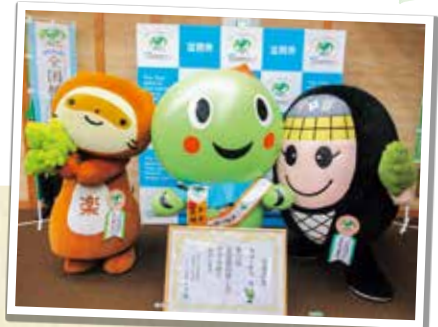
▲全国植樹祭甲賀市PR大使の「にんじゃえもん」と「ぼんぼこちゃん」も応援に来てくれました!