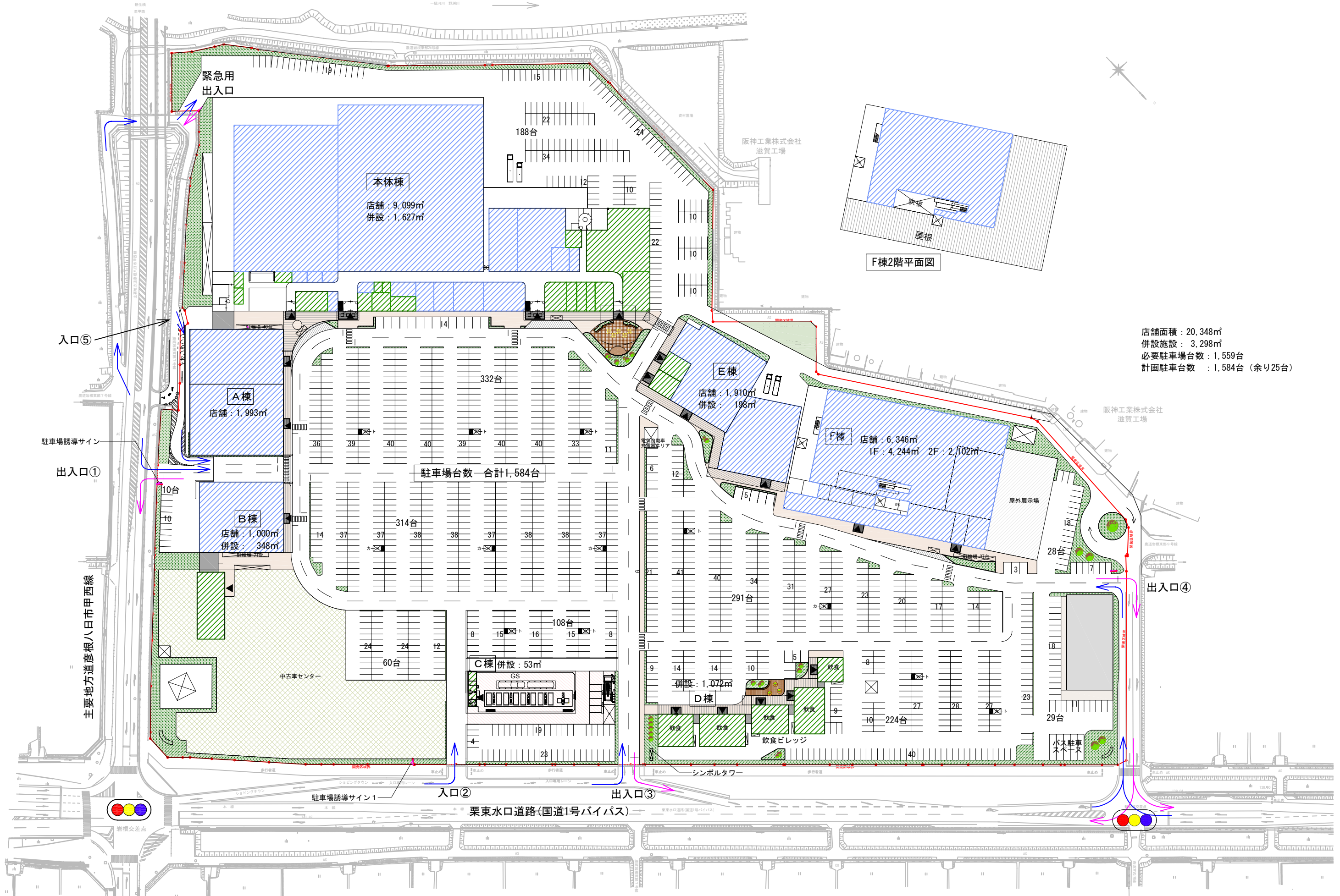
図2 建物配置図 SCALE 1:1500