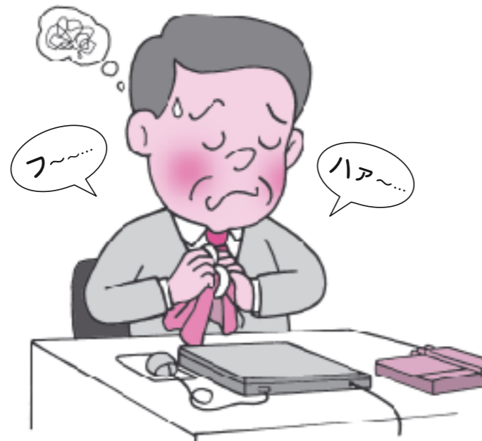
疲れた様子の時には声かけを

疲れていることを自覚しにくかったり、精一杯すぎて話すことを後回しにしています。自分ではなかなか気づけないので明るく声をかけてください。