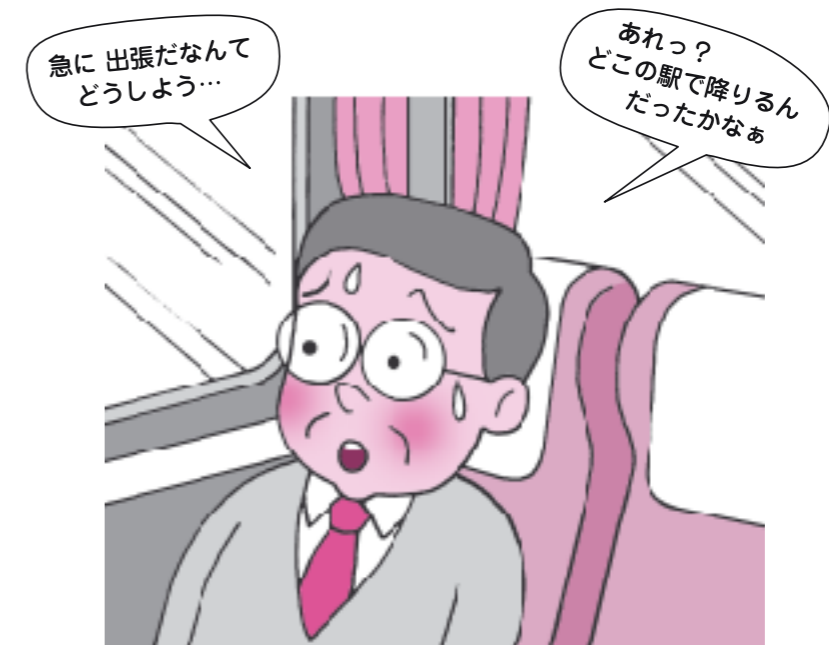
普段と違う環境の時にはサポートを

急なことに対応することが苦手になります。出張など、いつもと違う場合はサポートをお願いします。