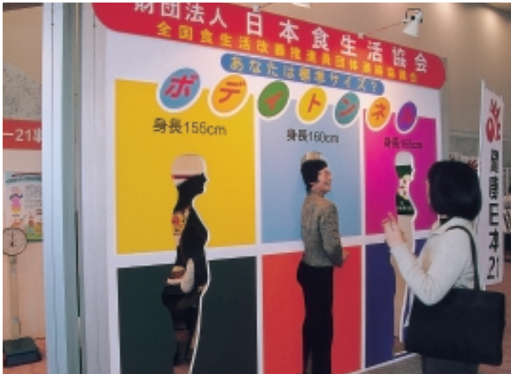
◎全国食生活改善推進員団体連絡協議会 (滋賀県健康推進連絡協議会)

当日、大ホールホワイエでは、11団体の様々な健康づくりに関する展示が行われました。大ホールでの基調講演やパネルディスカッションとともに全国大会を盛り上げていただきました。出展していただきました団体の皆様ありがとうございました。