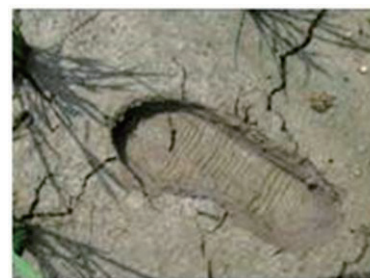
写真 中干しの程度