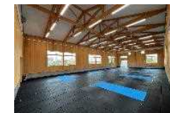
④木材利用 (木造化・木質化)