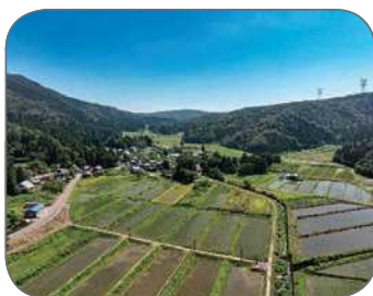
高島市在原地区の棚田