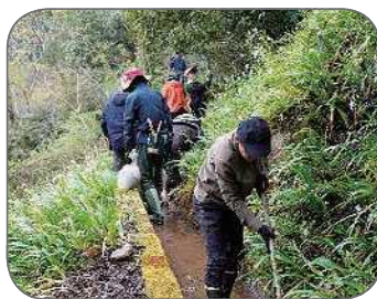
桶水からの水路掃除