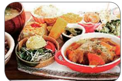
農家レストランでの食事