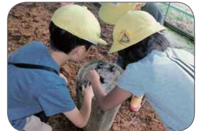
カブトムシふれあい体験

グリーンツーリズム滋賀ホームページより https://www.pref.shiga.lg.jp/gt-shiga/index.html