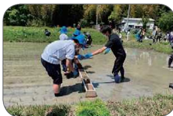
他団体との共同活動