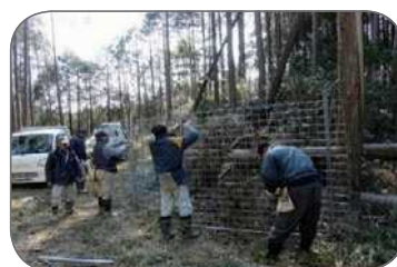
獣害防止柵の補修