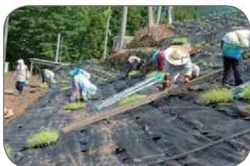
景観作物の作付け