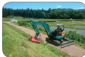
モアによる草刈り作業