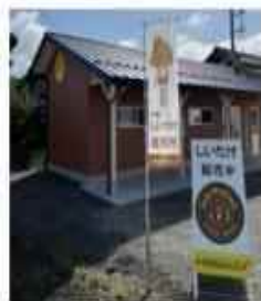
看板のある時は直売しています