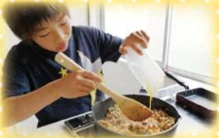
作者/淵上 颯真 題字/奈尾 柚実子

ぼくも作るの チャレンジしたら かぞくが ニコニコ よろこんだ また作りたいな 昼ごはん