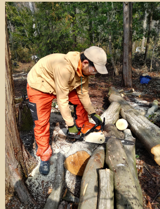
資源活用/薪づくり