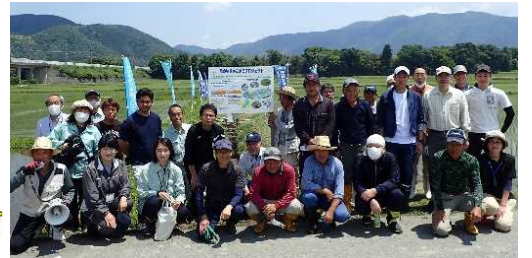
※魚道設置に参加したみなさん