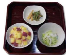
大阪から滋賀へ疎開してきた児童の昼ごはん (炊事日誌をもとに再現)