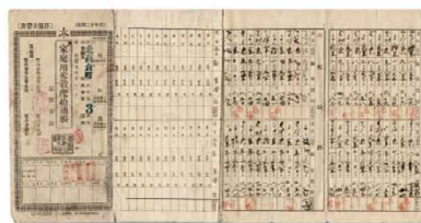
家庭用米穀配給通帳 昭和20年