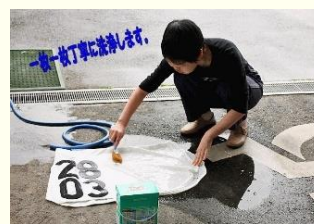
一枚ずつ丁寧に洗浄