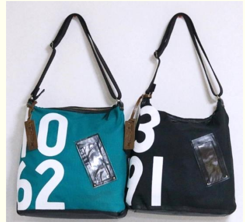
完成品! デザインは豊富 滋賀県栗東市のふるさと納税の返礼品 としても人気が高い

※アップサイクル:本来は捨てられるはずの製品に新たな価値を与えて再生することで、「創造的再利用」とも呼ばれている。