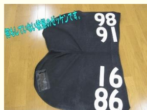
何もしていない状態のゼッケン