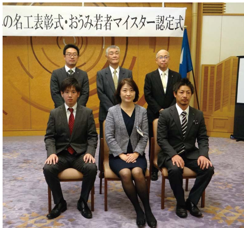
令和2年11月10日 (火) 滋賀県庁公館