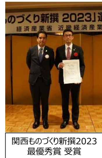
関西ものづくり新撰2023 最優秀賞 受賞