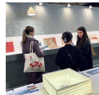
Maison & Objet出展の様子