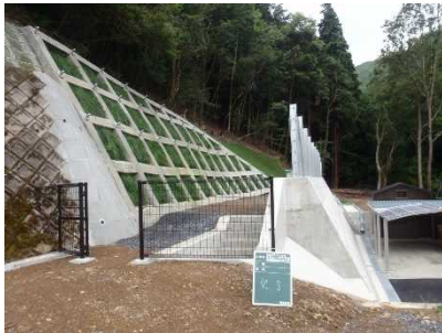
若葉台2地区【大津市若葉台】