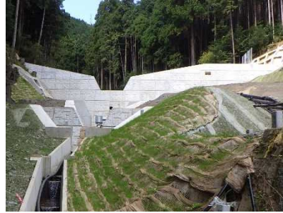
藤尾川【大津市藤尾奥町】