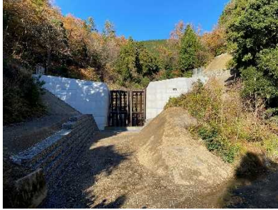
坪谷川【長浜市徳山町】