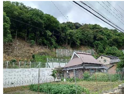
菅浦2地区【長浜市菅浦】