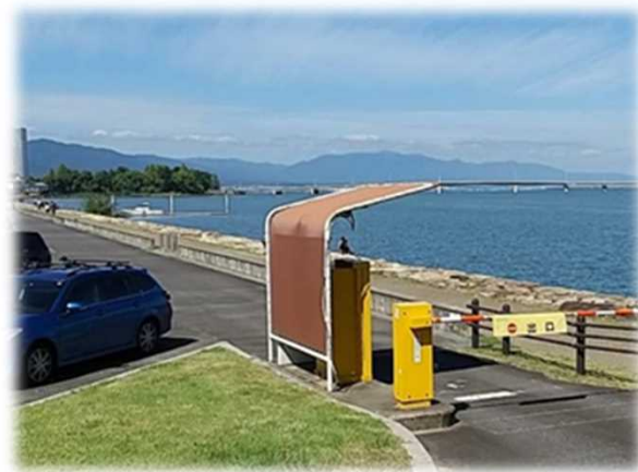
■ 有料駐車場の例(大津市内)