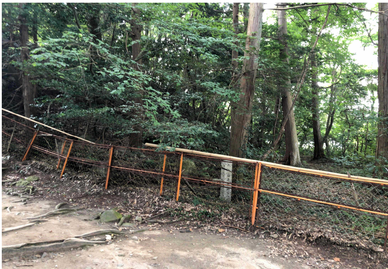
特別史跡安土城跡 発掘調査対象地