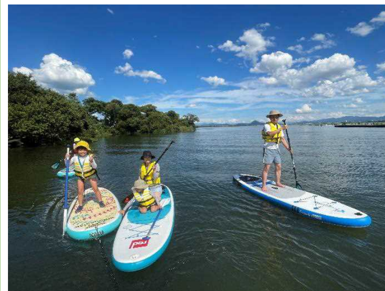
SUP体験会（湖岸緑地 衣川）