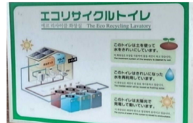
上下水道がなくても設置できるエコトイレ ※利用頻度が高いと処理が追い付かない ※維持管理コスト高