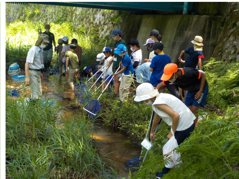
夏休み自然塾（希望が丘文化公園）