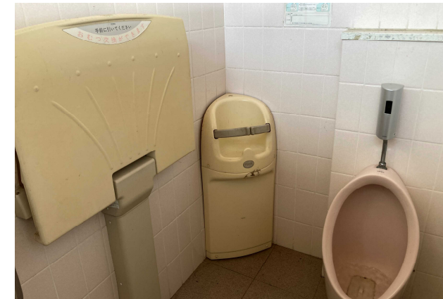
ベビーチェアやおむつ交換台