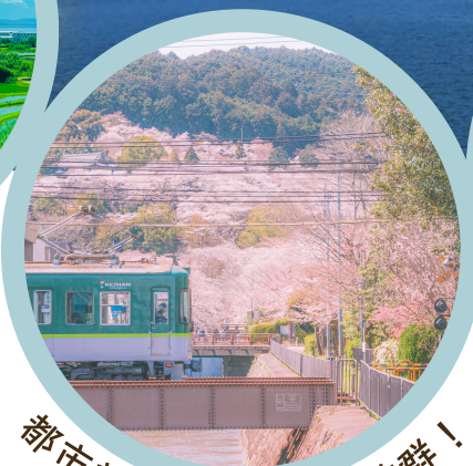
都市部へのアクセス抜群!