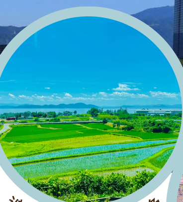
遮るものがない景色