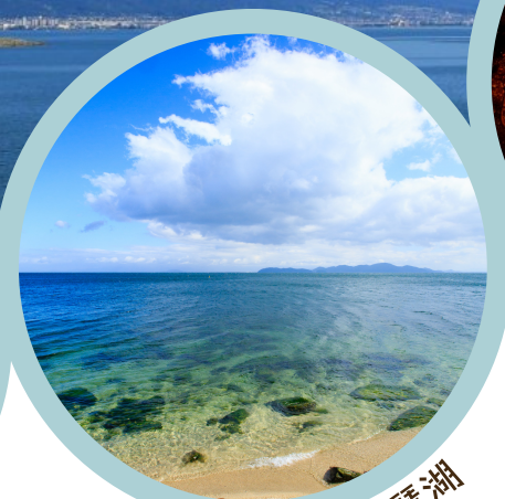
透明度の高い琵琶湖