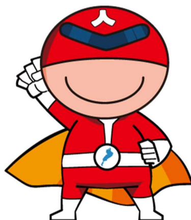
滋賀県人権啓発キャラクター ジンケンダー