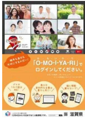
ポスター（人権週間編）