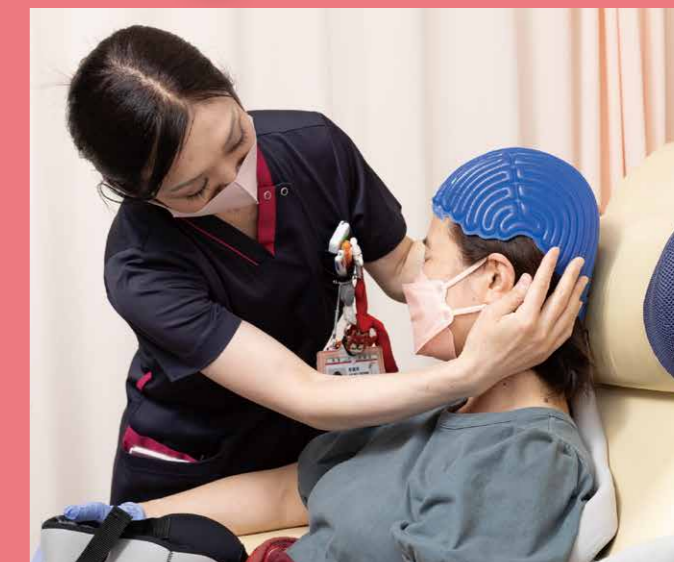
患者さんのサイズにあったキャップを丁寧に密着させます

当院で手術を予定している、あるいは受けられた周術期の化学療法を受けられる患者さんのうち、強いご希望のある方に使用いただいています。費用は保険診療外のため、全額自己負担となります。