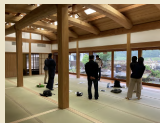
宿泊施設(予定) 「改修された古民家」