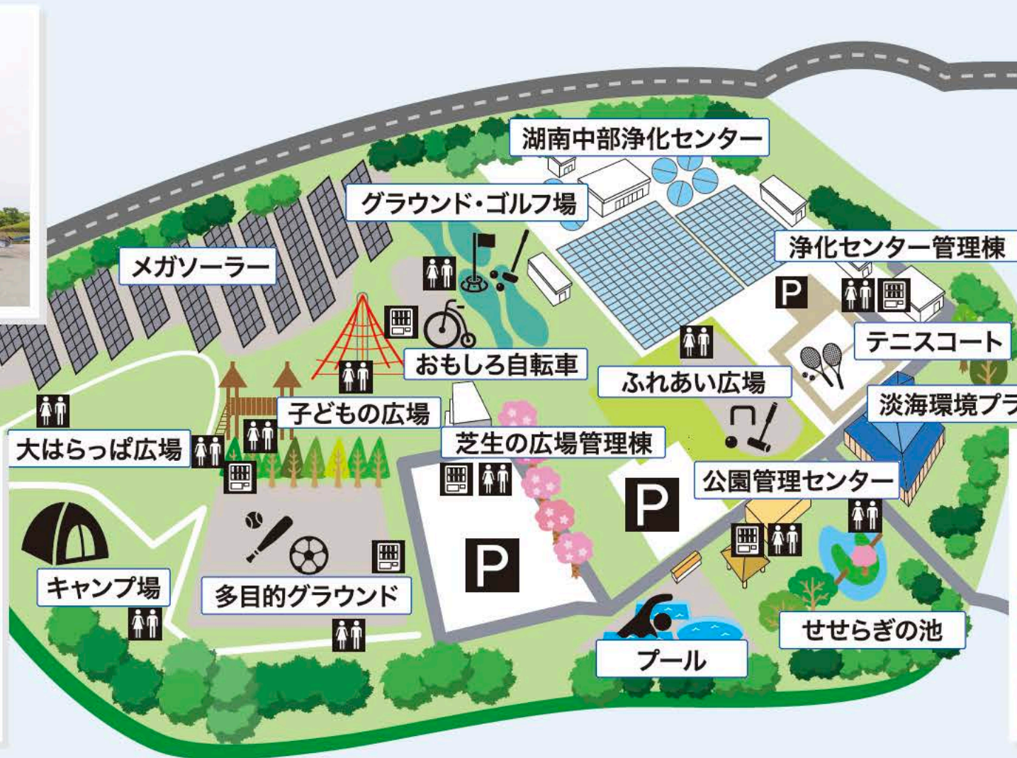
グラウンド・ゴルフ場