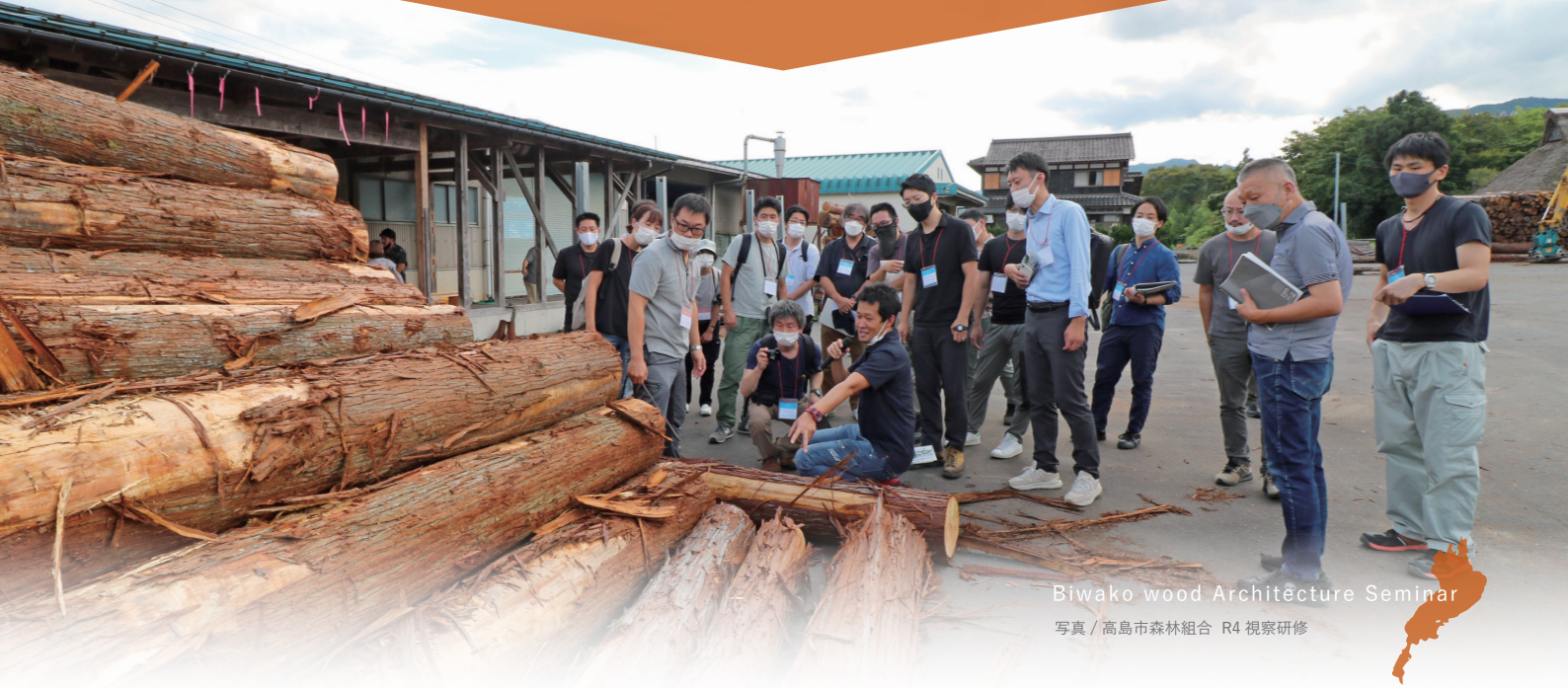
Biwako wood Architecture Seminar