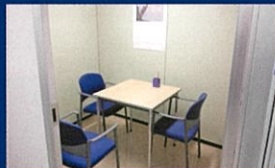
個室カウンセリング ルームもあります（2ヶ所）

ご相談（ハローワーク/シニア相談コーナー）は雇用保険受給認定時の「求職活動実績」となります