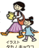
イラスト タカノ キョウコ

滋賀マザーズジョブステーションは、「子どもがいるんだけど、どうしたら働けるの?」「子育てが一段落したから、もう一度働きたい!」…そんな想いを持つ女性などが、就職活動をスムーズにはじめてもらえるよう支援する無料の相談窓口です。スマートフォン・パソコンによるオンライン相談も実施しています。お問い合わせ・ご予約は、滋賀マザーズジョブステーション・近江八幡総合受付まで。