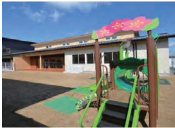
滋賀県長浜市三ツ矢元町 24-3