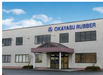
滋賀県草津市山寺町 271 番 1 号