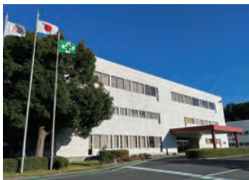
滋賀県近江八幡市南津田町 1950