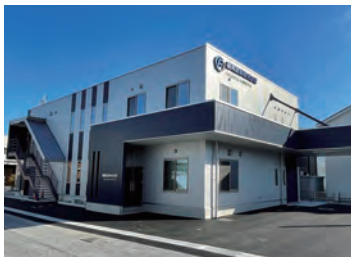
滋賀県長浜市神照町 888-6