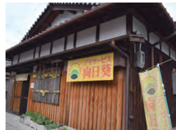
滋賀県草津市北山田 866