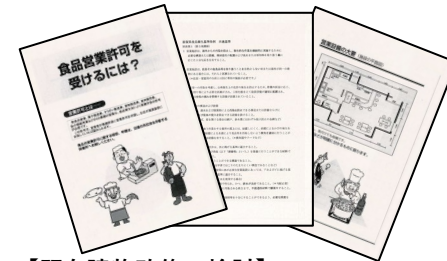
【既存建物改修の検討】 既存の建物を改修し加工施設として利用するための要件等について検討。