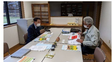
【兵庫県養父市での事例調査】 集落ぐるみでのサンショウの生産・加工体制、加工施設等の聞き取り・視察を実施。