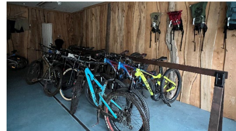
【静岡県西伊豆町での事例調査】 トレイル・ガイドの運営体制、運営主体と地域との関係等の聞き取り、拠点施設等の視察を実施。