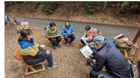
【静岡県森町での事例調査】 パークの運営体制、用地の山林所有者や地域との関係、事業運営方針等を聞き取り。パーク視察・試走を実施。