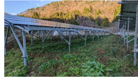
【米原市北伊吹地域での取り組み】 サンショウ、ミョウガ等の栽培に取り組み始めている。写真はソーラードライヤーでのミョウガ栽培地。