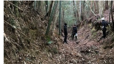
【栗東市金勝地域での取り組み】 古道を活かしたマウンテンバイクコースを整備中。