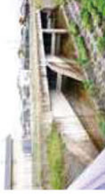
新守山吐出口 (守山市三宅町)