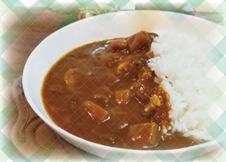
作者/古山 礼 題字/高橋 明日実

ぼくは、皮むき。 兄は、野菜切り。 父がいたため、 できあがり。 母への プレゼント。 特大 カレーライス。