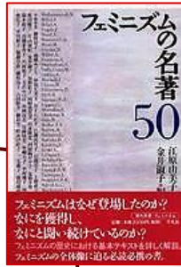
『フェミニズムの名著50』 (平凡社)

『フェミニズムの名著50』（平凡社）を参考にフェミニズムの名著・古典といわれる著作とその著者に関する本をまとめて配架しています。