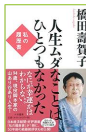
『人生ムダなことはひとつもなかった』