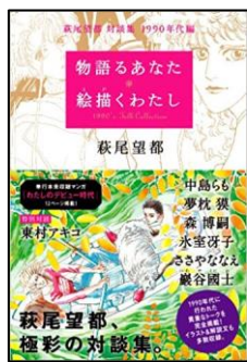
『物語るあなた 絵描くわたし』