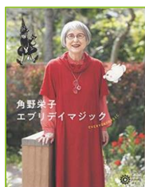
『角野栄子 エブリデイマジック』