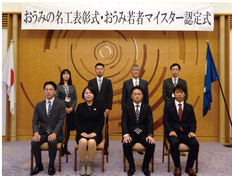
令和4年11月7日(月) 滋賀県庁公館