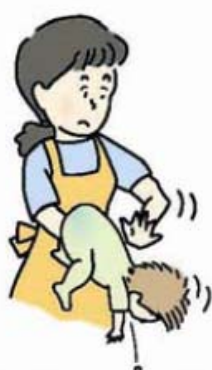
図 1 背部叩打法 (乳児)

乳幼児では、口の中に指を入れずに、乳児は片腕にうつ伏せに乗せ顔を支えて (図 1)、また、少し大きい子は立て膝で太ももがうつ伏せにした子のみぞおちを圧迫するようにして (図 2)、どちらも頭を低くして、背中の中を平手で何度も連続して叩きます。なお、腹部臓器を傷付けないよう力を加減します。