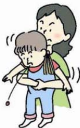
図 3 ハイムリッヒ法 (年長児)

大人や年長児では、後ろから両腕を回し、みぞおちの下で片方の手を握り拳にして、腹部を上方へ圧迫します (図 3)。この方法が行えない場合、横向きに寝かせて、または、座って前かがみにして背部叩打法を試みます。