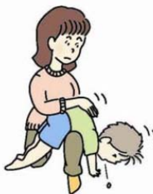
図 2 背部叩打法変法 (少し大きい子)