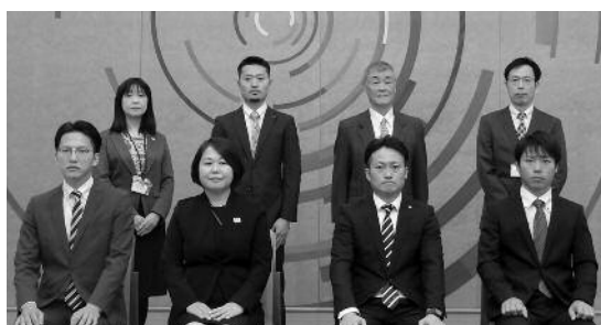
▲「おうみ若者マイスター」認定者