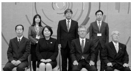
▲「おうみの名工」表彰受賞者