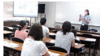
第1回セミナーの様子

ママ これまで家事はどちらか一人に負担がかからないように、早く帰った方がしていたのですが、「私ばかり」「僕ばかり」とケンカになることもありました。講座を受講して、家事について二人で話し合っていたし合っていないし合ったこと、そして話し合うことの大切さに気づきました。