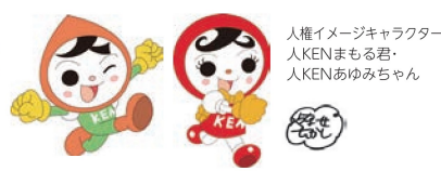
人権イメージキャラクター 人KENまもる君・人KENあゆみちゃん