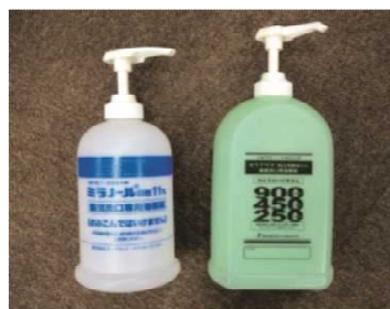
ディスペンサーボトル