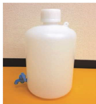
溶解用ポリタンク