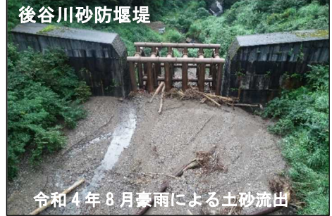
令和4年8月豪雨による土砂流出