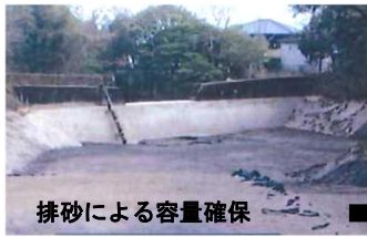
排砂による容量確保