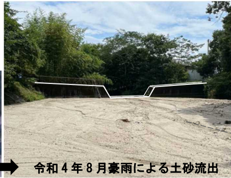
令和4年8月豪雨による土砂流出