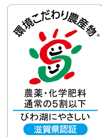
環境こだわり農産物 認証マーク

これまで重点的に進めてきた「環境こだわり農業」の更なる拡大を図るとともに、農薬や化学肥料を使用しないオーガニック農業、トレーサビリティシステムの構築やGAP手法の実践など、滋賀ならではの環境や人に配慮した持続可能な生産体制をより一層推進する。