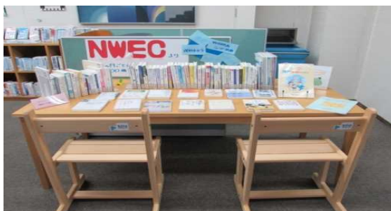
G-NETしが NWEC 図書貸出しコーナー

NWEC(独立行政法人国立女性教育会館)が提供する男女共同参画をテーマとした図書パッケージ貸出しサービスを活用し、専用コーナーを設けるなど、図書・資料室の積極的なPRを行った。