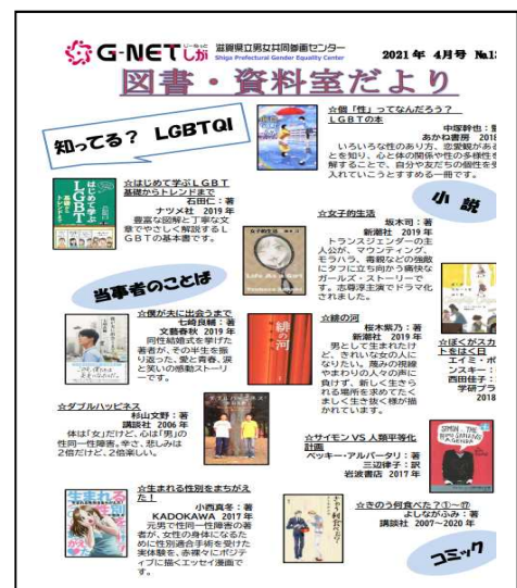
図書・資料室だより 令和3年 10月号