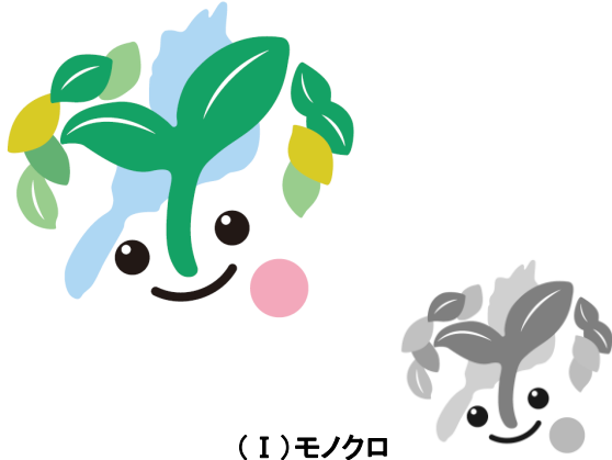
シンボルマークのみ(Ⅰ)