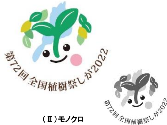
シンボルマーク+大会名(Ⅱ)